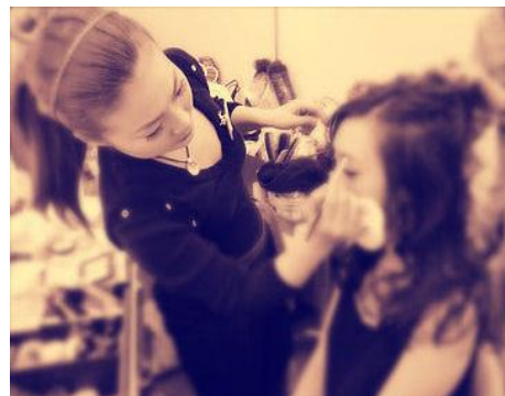
まつや 株式会社 代表取締役 国際メイクアップアーティスト&スकिनセラピスト